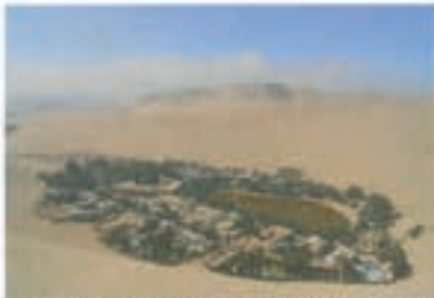
In der Wüstenoase Huacachina in Peru hat sich das Ehepaar gefunden

„Schon immer zog es mich in die Ferne. Mit 17 bereiste ich für ein halbes Jahr Asien, ein Jahr später Südafrika und dann 2013 ging es für unbestimmte Zeit nach Südamerika. Peru sollte für mich nur eine Station auf dieser Reise sein. Doch dann traf ich mitten in der Wüste die Liebe meines Lebens ...“