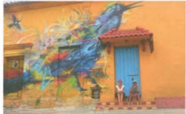
In Cartagena in Kolumbien